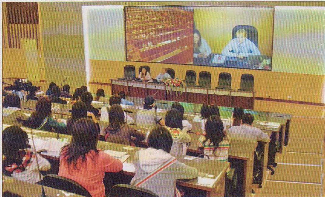
Der Lienzer beim Unterrichten in China. Eine Dolmetscherin übersetzte von Englisch auf Mandarin.

Der Lienzer absolvierte die HTL und arbeitete dann ein halbes Jahr als Softwareprogrammierer bei BMW. Dann schloss er sein Bachelor-Studium (Medientechnik und Design) in Hagenberg ab, bevor er auf die Uni Linz ging.